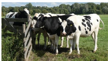
La laiterie s'alimente auprès d'une cinquantaine d'éleveurs lorrains bio

Le GAEC de la MEIX, à l'origine de l'entreprise et toujours adossée à la fromagerie, fournit le lait destiné à la fabrication des fromages à pâtes pressées non cuites.